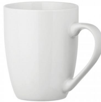
Abb. 2: Tasse