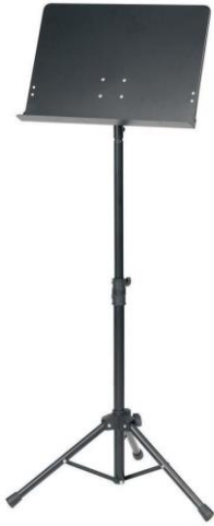
Abb. 1: Notenpult aus Metall